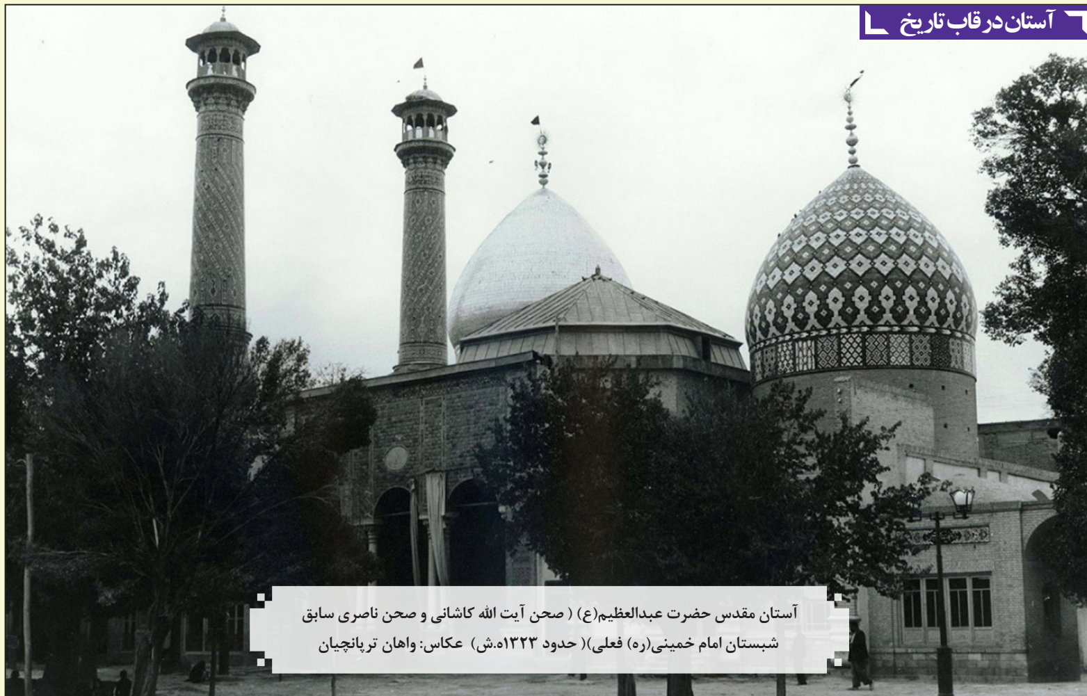
آستان مقدس حضرت عبدالعظیم (ع) (صحن آیت الله کاشانی و صحن ناصری سابق شهبستان امام خمینی (ره) فعلی) (حدود ۱۳۲۳ ه.ش)